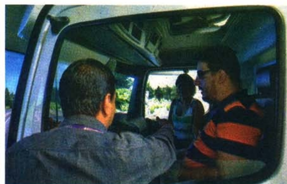
Instrutor orienta profissionais da imprensa